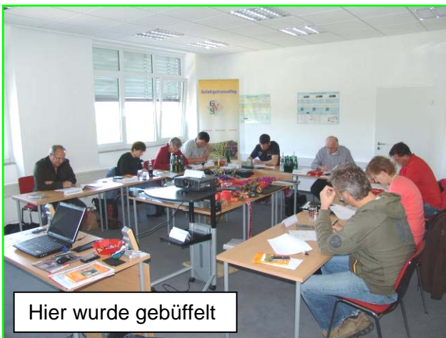
Hier wurde gebüffelt

Seminarteilnehmer waren sehr zufrieden mit dem 1-wöchigen Seminar