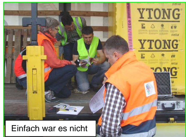
Einfach war es nicht